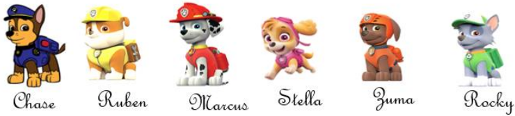
Parcours des petits