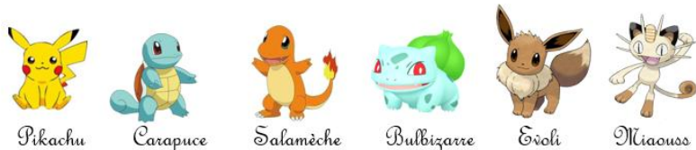
Parcours des moyens